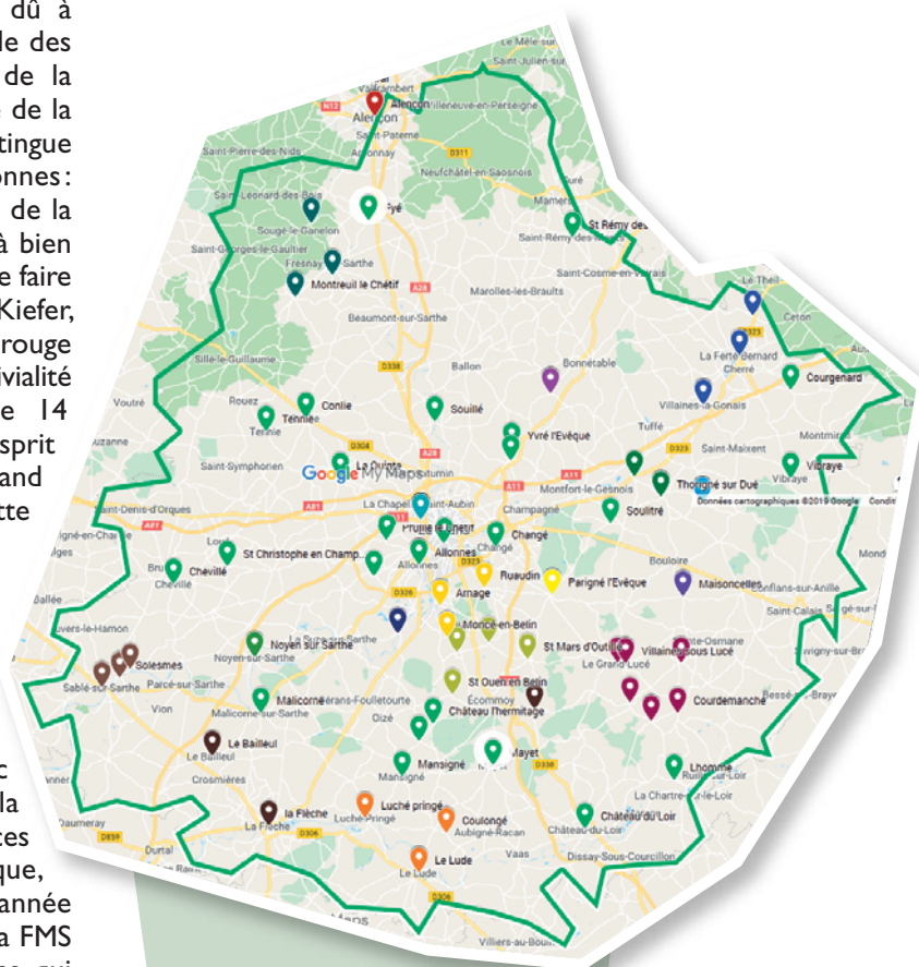
Localisation des stagiaires en Sarthe